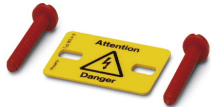
Abbildung zeigt die Variante WS 4- 8

http://eshop.phoenixcontact.de/phoenix/treeViewClick.do?UID=0805357