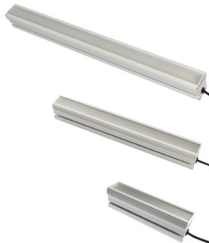
Eine neutralweiße Lichtfarbe liefern diese quaderförmigen LED-Leuchten in drei verschiedenen Längen.

Stellvertretend für die große Auswahl an quaderförmigen Arbeitsplatzleuchten werden hier die AO000261 , AO000274 und AO000275 mit neutralweißer Lichtfarbe (4.500K) sowie die AO000482 , AO000483 , AO000484 und AO000485 mit kaltweißer Lichtfarbe (5.000K) vorgestellt. Die AO000261 , AO000274 und AO000275 im Aluminiumgehäuse und Frontscheibe aus Acrylglas (Schutzart IP50) sind für den Dauerbetrieb geeignet, wobei die Helligkeit geregelt werden kann. Alle LED-Leuchten haben eine Breite von 64mm sowie eine Tiefe von 80mm und sind in den Längen 254mm ( AO000274 ), 504mm ( AO000261 ) und 754mm ( AO000275 ) erhältlich. Die Leistungsaufnahme bewegt sich zwischen 20W für die kleinste Leuchte und 60W für die größte Ausführung. Der Abstrahlwinkel beträgt 100°.