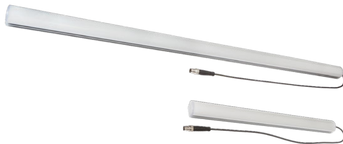
Röhrenförmige LED-Arbeitsplatzleuchten AO000307 (unten) und AO000308 mit 6 und 12 LED.

Die röhrenförmigen LED-Leuchten AO000307 (300 x 28 x 23mm) und AO000308 (600 x 28 x 23mm) im Aluminiumgehäuse (Schutzart IP40) integrieren 6 bzw. 12 LED und verfügen über eine kaltweiße Lichtfarbe (5.000K). Der Abstrahlwinkel dieser kompakten LED-Leuchten mit Frontscheibe aus Kunststoff beträgt 120°. Die einfache Montage erfolgt über Halteklammern, die im Lieferumfang enthalten sind.