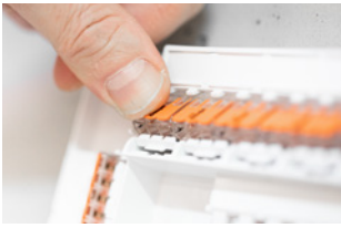
Klemme in Aufnahme einrasten.