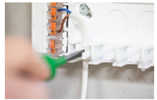
Kabel in Zugentlastung einsetzen.