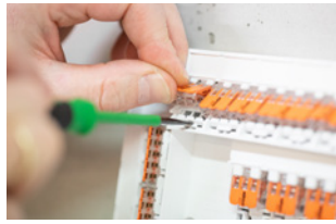
Klemme aus Aufnahme lösen.