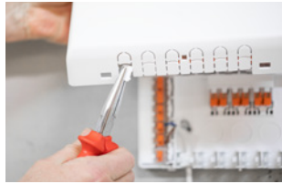
Kabeleinführung aus dem Deckel brechen.