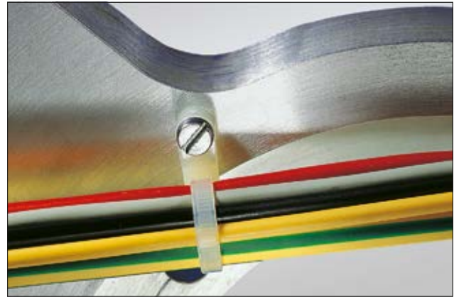
Mit der Befestigungsöse des T50MR ist der Kabelbinder leicht auf jedem Untergrund anzuschrauben.