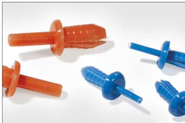
HelaDuct Spreiznieten HTWD-R4 und HTWD-R6.