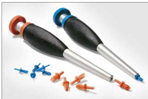
HelaDuct Nietsetzwerkzeuge HTWD-RT4, -RT6.