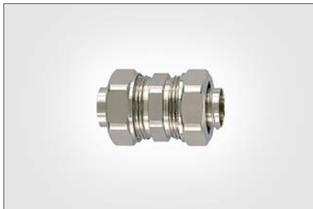
HeloGuard PCS-PCS Kompressionsverbinder für zwei PCS-Schläuche.