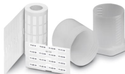
Abbildung zeigt die Produktvariante EML (20X8)R

http://eshop.phoenixcontact.de/phoenix/treeViewClick.do?UID=0815583