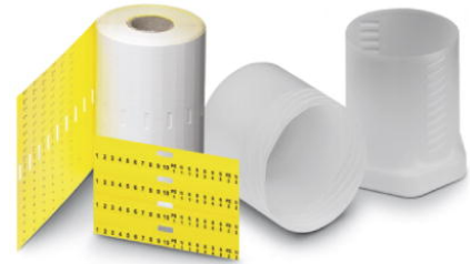
Abbildung zeigt den Artikel TMT 4 R YE

http://eshop.phoenixcontact.de/phoenix/treeViewClick.do?UID=0816605