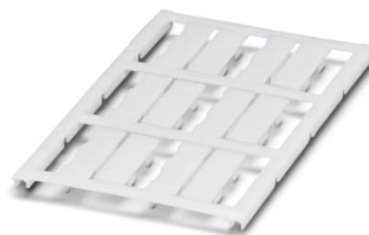
Bild zeigt Variante in weiß

http://eshop.phoenixcontact.de/phoenix/treeViewClick.do?UID=0818933