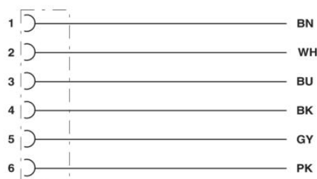
Kontaktbelegung der M8-Buchse