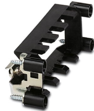
Abbildung zeigt die Variante VC-TR 1/2 M-PEA

http://eshop.phoenixcontact.de/phoenix/treeViewClick.do?UID=1607075