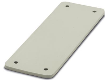
Abbildung zeigt eine Variante des Artikels

http://eshop.phoenixcontact.de/phoenix/treeViewClick.do?UID=1660371