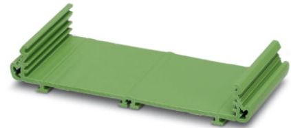
Abbildung zeigt die Variante UM 45-Profil CM

http://eshop.phoenixcontact.de/phoenix/treeViewClick.do?UID=2907525