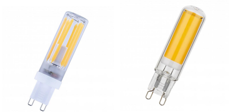
145242 LED FIL G9 DIM 3.5W (32W) 350lm 927 Klar