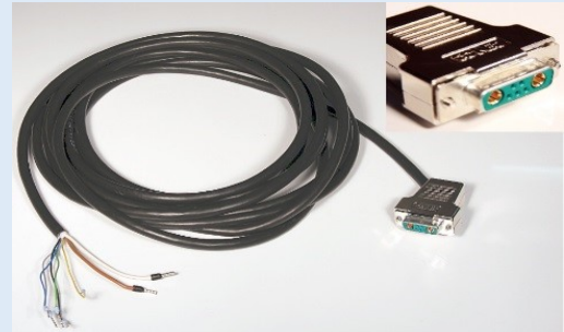
Beispielfoto / example image

Connection cable SubD 2+5-pole, 10 m long. For connecting planistar lights with a SubD connector.