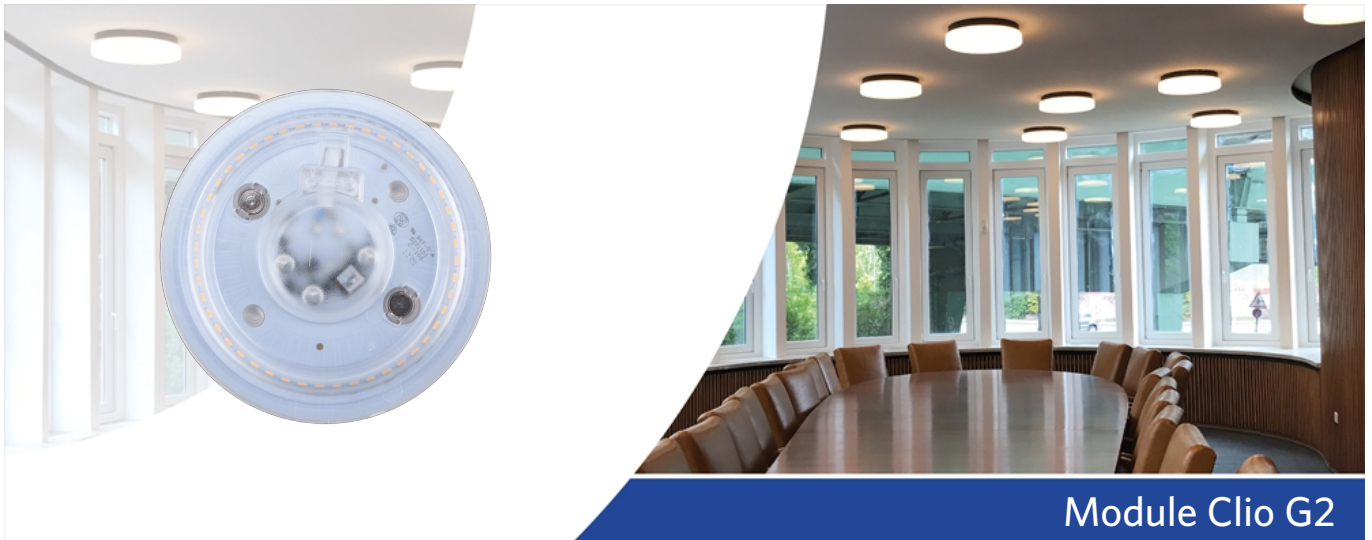
Module Clio G2