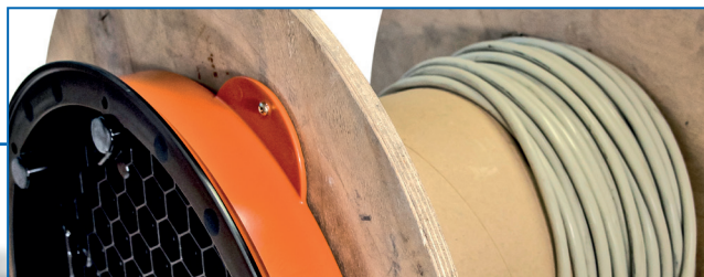
Lasche für Verschraubung