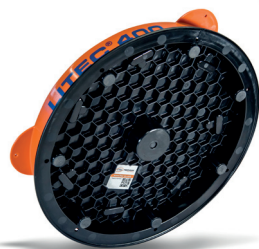
Wabenstruktur für zusätzliche Stabilität