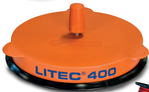
Trommel mit einem Innendurchmesser ab 13 mm