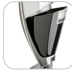
Leicht zu entleeren