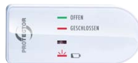
MINI-SENDER FÜR FENSTER