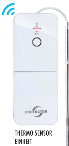
THERMO-SENSOR-EINHEIT FÜR OFENROHR