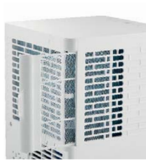
Leicht zu reinigende Filter

Feel good inside – jederzeit und überall mit Ihrem AirBlue Klimagerät!