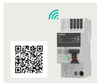
SETRON ECPD 5TY1 COM Bestellhinweis